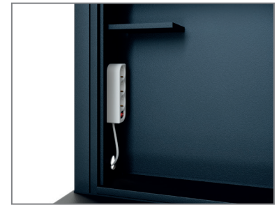
Medienschrank mit Mehrfachstecker und Ablage