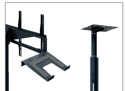
erweiterbar mit Laptop- / Kamera-Aufnahme